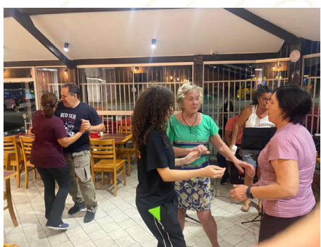
Nosso Encontro 7 de outubro