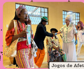
Jogos de Afeto (pessoas 50+)