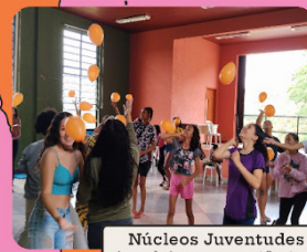
Núcleos Juventudes (também em periferias)

Além de Cursos Livres de Teatro, Núcleos de pesquisa, Oficinas, Sábados e Centro de Pesquisa e Memória do Teatro (CPMT). Apoie para que tudo isso continue!