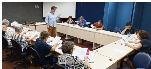
Aula ministrada na sede da OAP