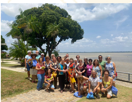
Clube de Viagem Belém - PA