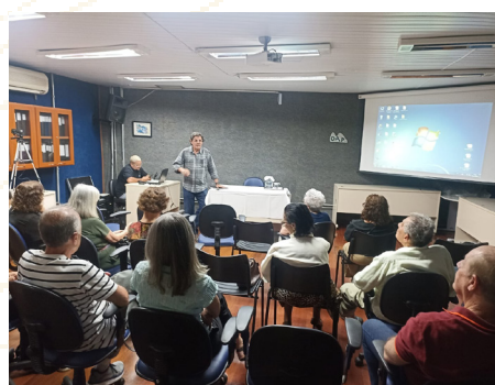
Tarde Cultural 13 de novembro