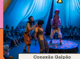
Conexão Galpão (escolas públicas e interior)