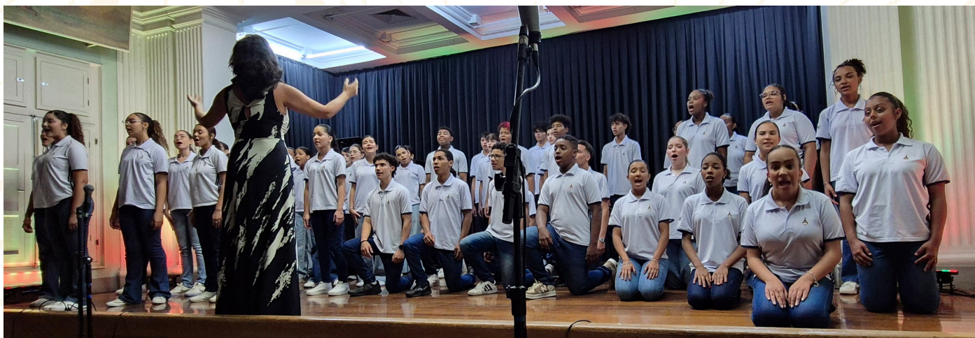
Concerto de Primavera - Coral Juvenil Cariúnas

CONFIRA A PROGRAMAÇÃO BÁSICA DA OAP PARA 2026