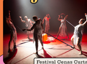
Festival Cenas Curtas (25 edições)