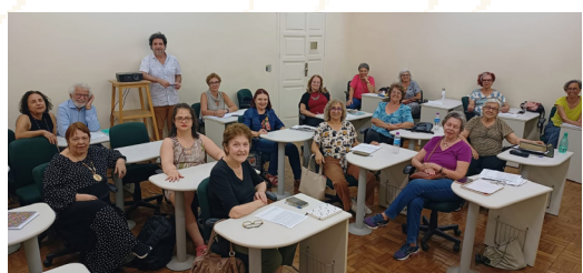
Aula ministrada no Conservatório UFMG