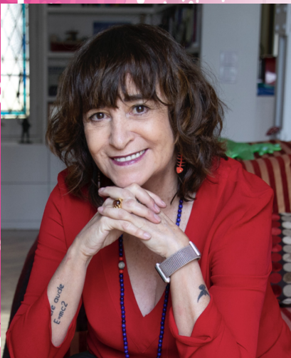
Rosa Montero - escritora espanhola

Não vou adentrar estas águas, na medida em que já tenho muitos temas para escrever histórias. Fico com o poema que consegui concatenar. E também quero agradecer à Rosa Montero por ter personificado esta qualidade que tanto ajuda os escritores na sua fase de criação artística, de um modo onírico e poético.